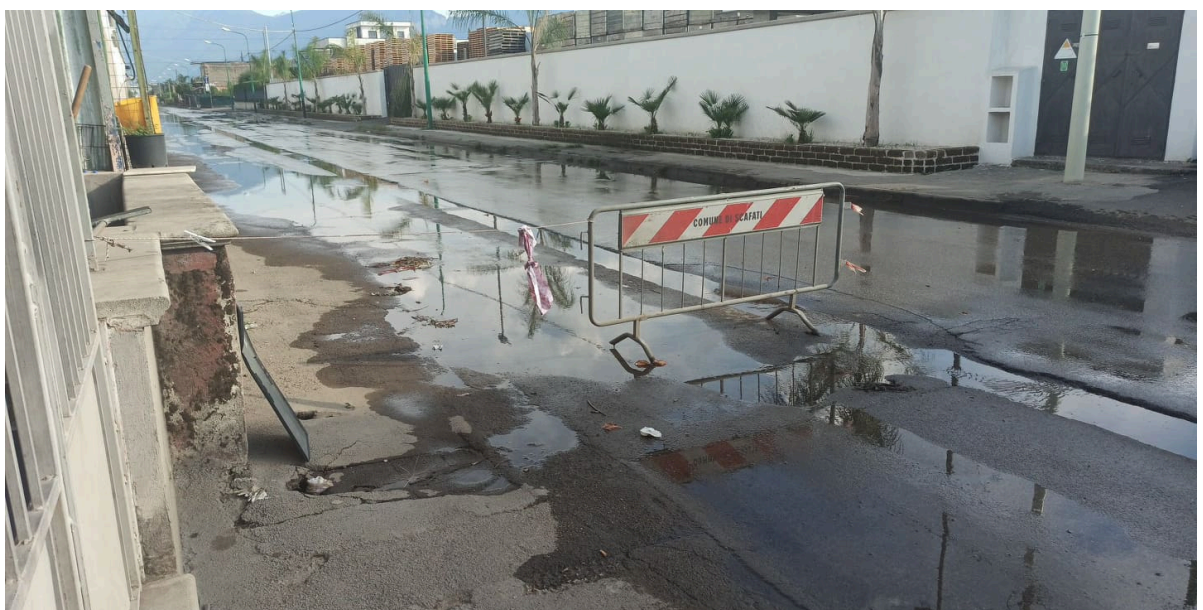
Strada allagata in Via Nuova San Marzano e Via Lo Porto in Scafati (Sa)

Il Canale Conte di Sarno potrebbe essere una soluzione per raccogliere le acque meteoriche che provengono dal monte e vulcano. Una vera e propria grondaia che tarda ad essere rifunzionalizzata. Inoltre ad aggravare la condizione già pessima sono le immissioni presumibilmente abusive di industrie che fanno defluire i propri reflui nelle canalizzazioni di acque bianche a bordo strada di Via Nuova San Marzano.