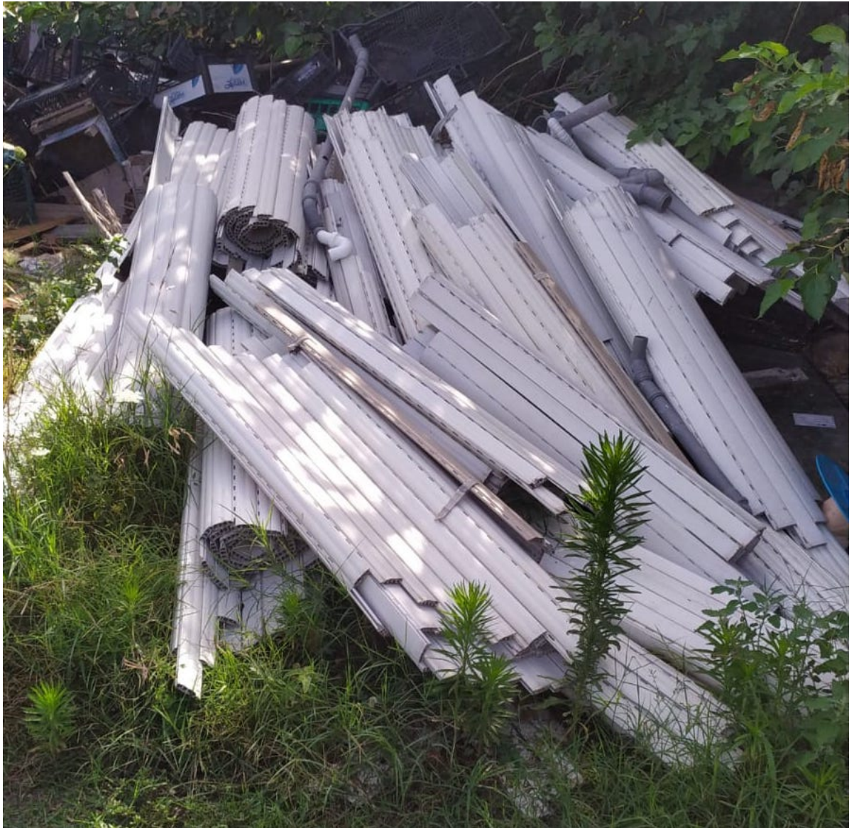
■ Rifiuti abbandonati