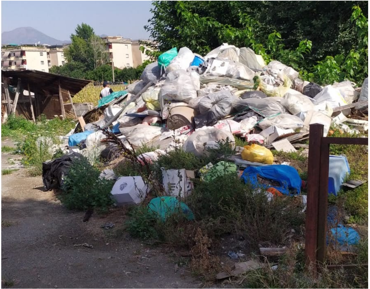
Cumulo di rifiuti

Il CNSBII, deve di nuovo documentare l'inciviltà dei cittadini. In altre parole, dei cittadini, in barba alle norme comunali, abbandonano rifiuti. Ad essere ritrovato un sito di oltre 50 mq di immondizia di vario genere con annessi altri 1700 mq di rifiuti abbandonati in modo incontrollato. I luoghi di abbandono sono aree naturali e agricole. Si nota così che alcuni non hanno ancora compreso il sistema di conferimento dei rifiuti nel proprio comune.