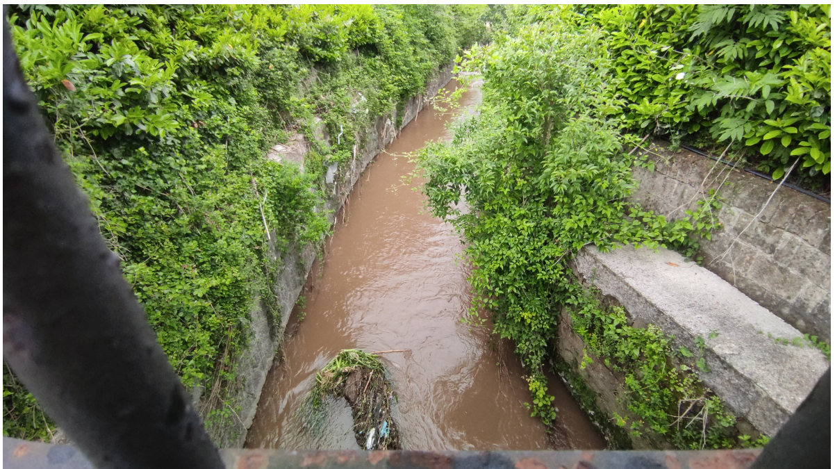
■ Torrente Solofrana in Mercato San Severino nella frazione di Pandola