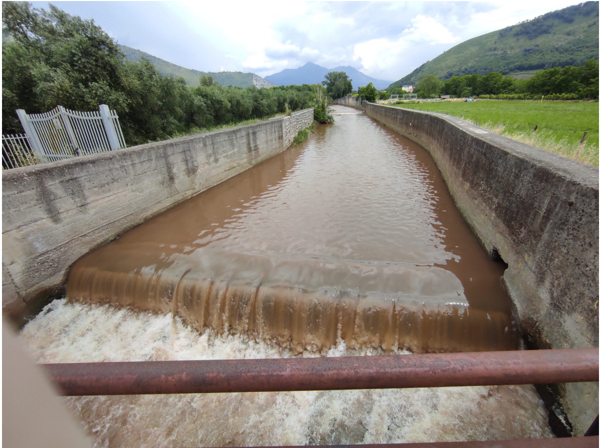
■ Torrente Solofrana in Mercato San Severino nella frazione di Sant'Eustacchio al confine con Castel San Giorgio