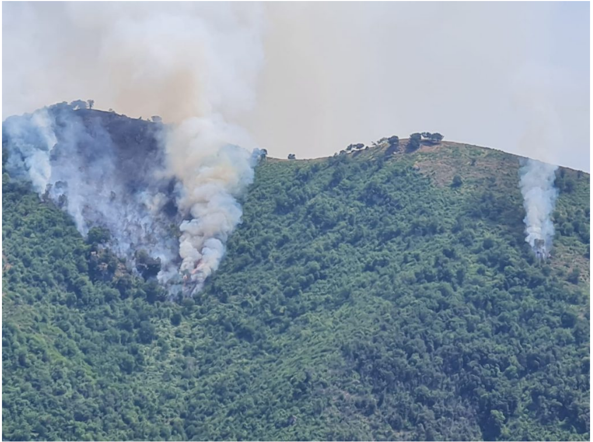
■ Incendio Monte Citola del 28 luglio 2021