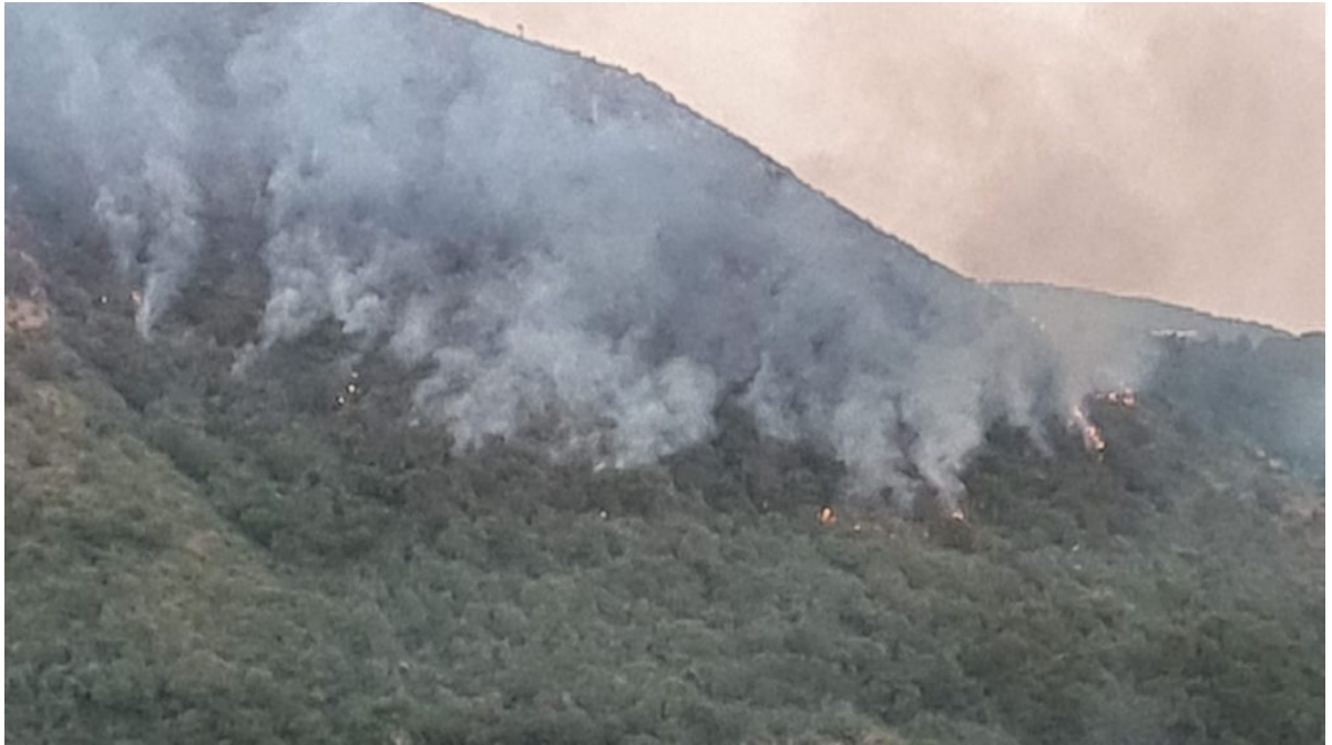
■ Incendio Monte Citola del 29 luglio 2021