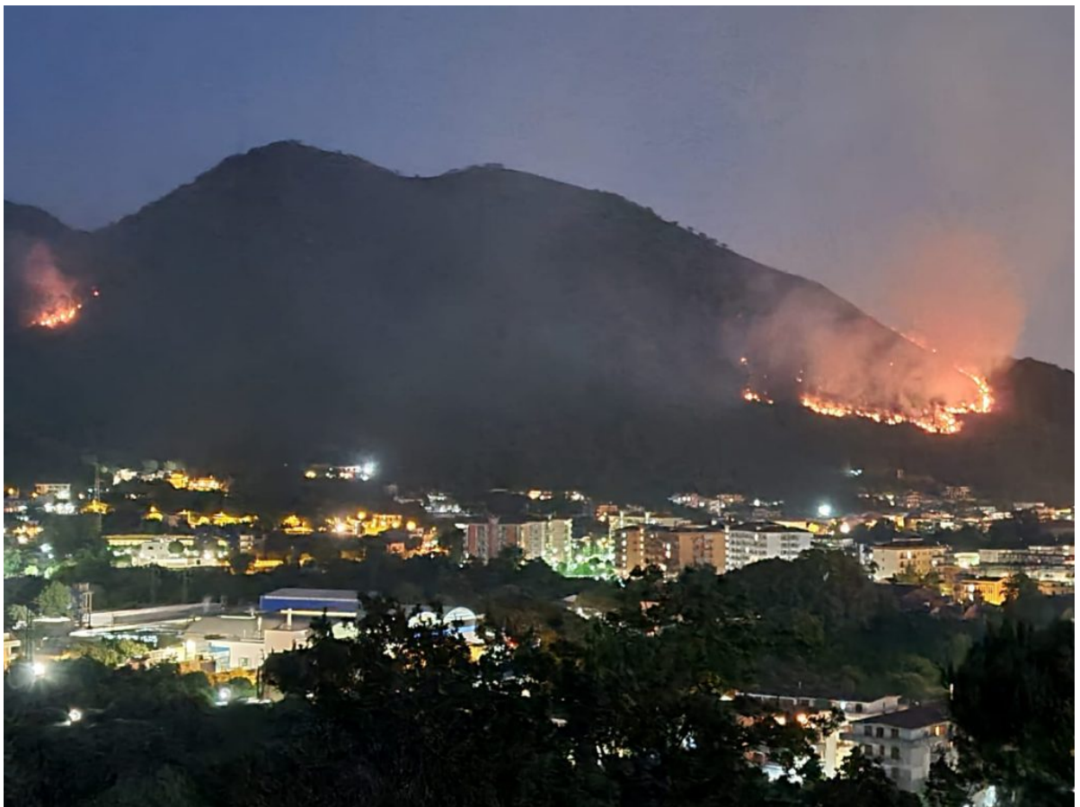
Incendio Monte Citola del 29 luglio 2021