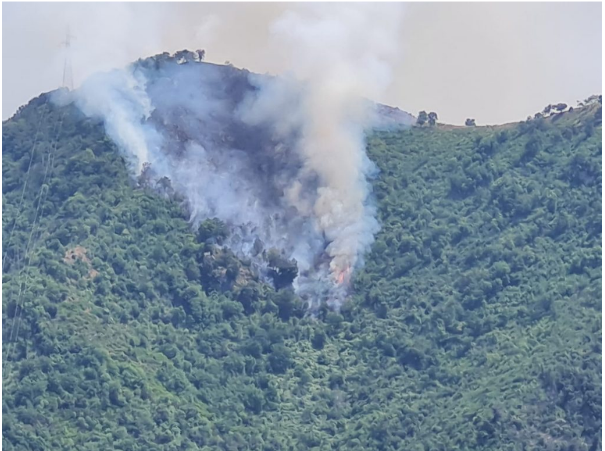
■ Incendio Monte Citola del 28 luglio 2021