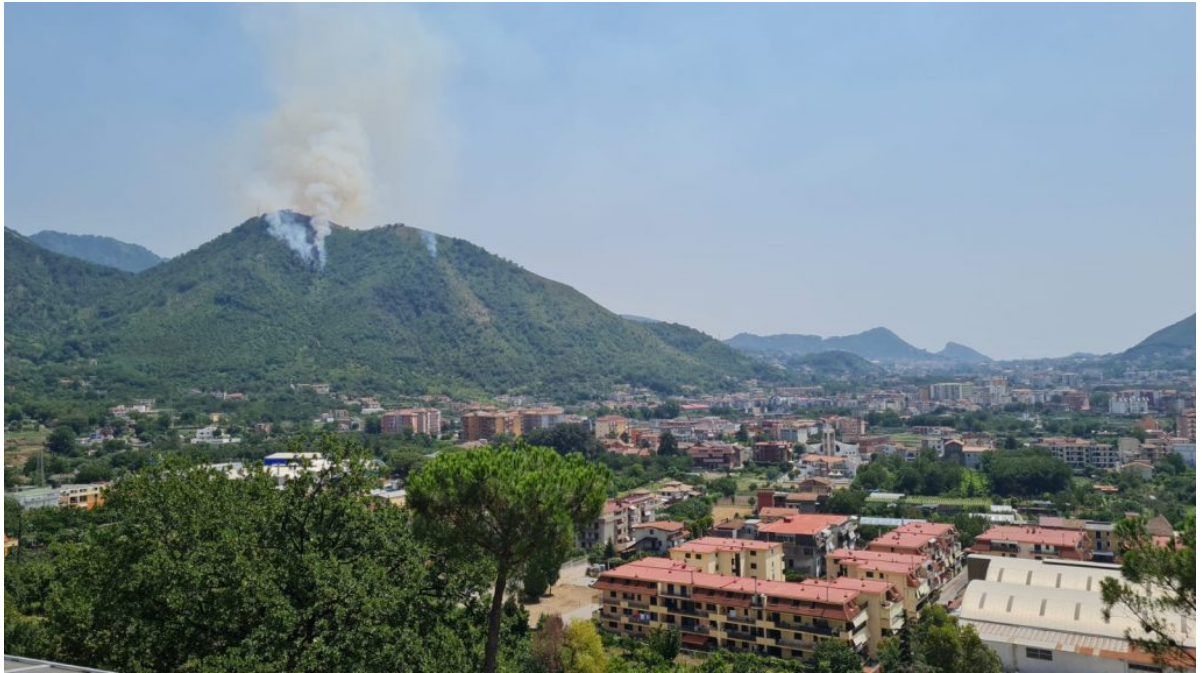
■ Incendio Monte Citola del 28 luglio 2021