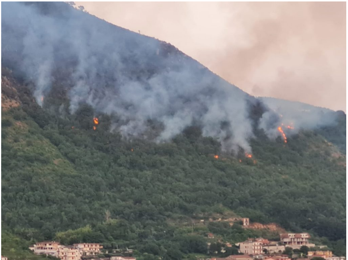
■ Incendio Monte Citola del 29 luglio 2021