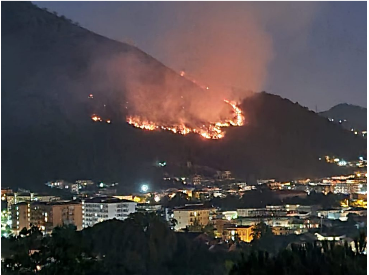
Incendio Monte Citola del 29 luglio 2021