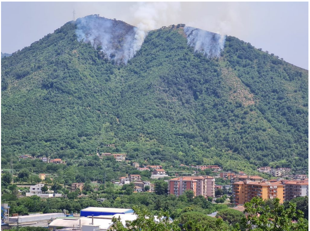
■ Incendio Monte Citola del 28 luglio 2021