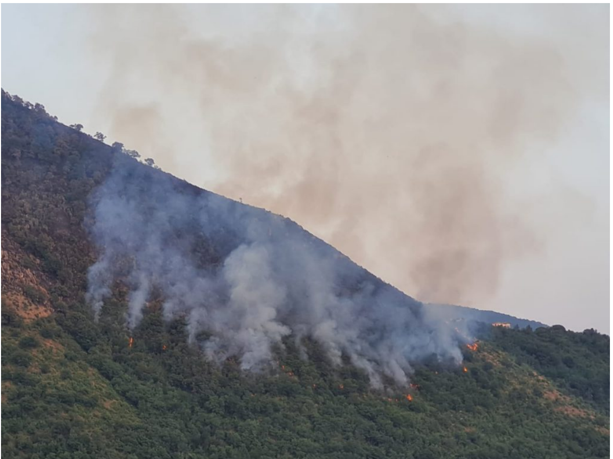
■ Incendio Monte Citola del 29 luglio 2021