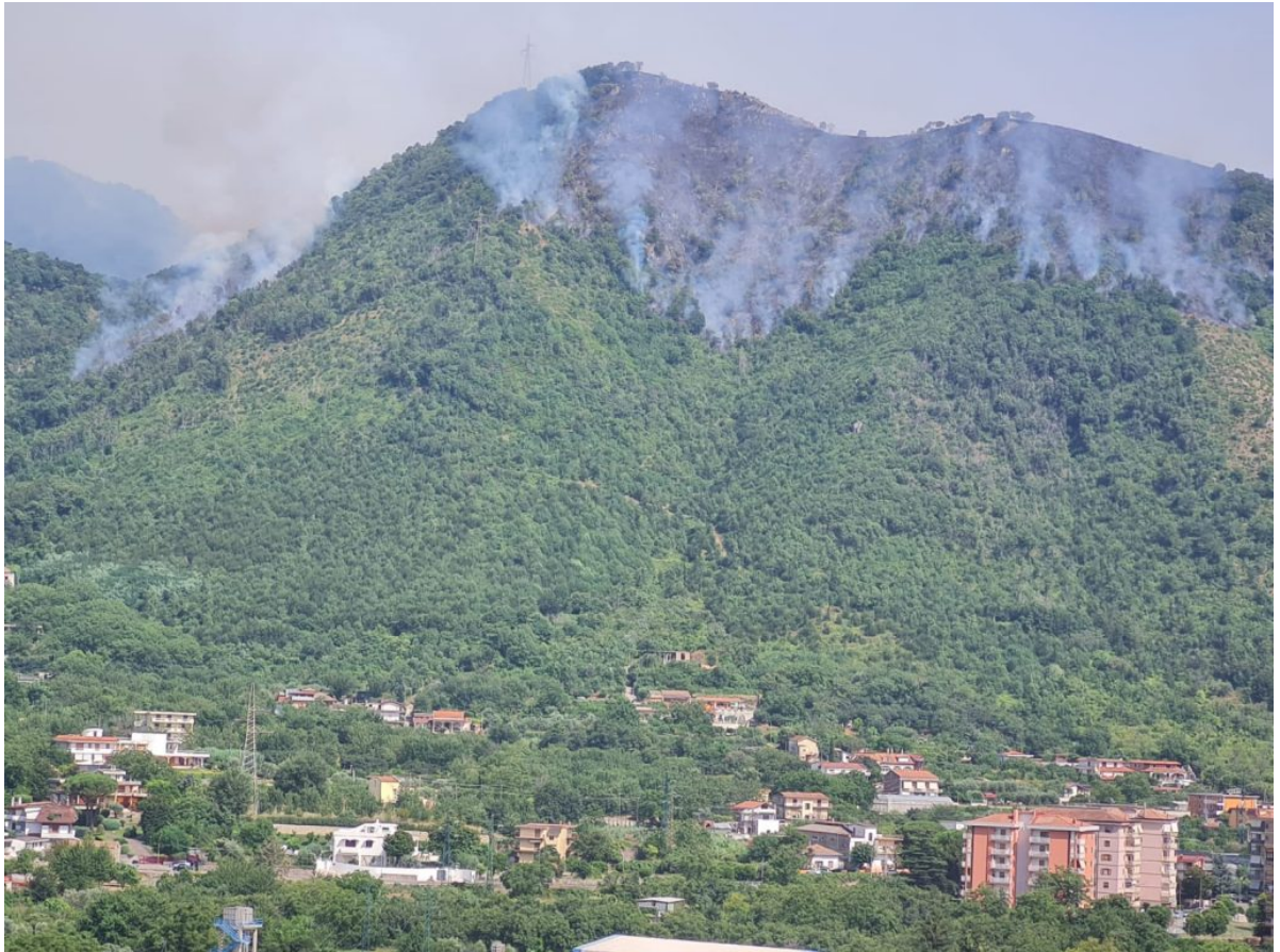
■ Incendio Monte Citola del 28 luglio 2021