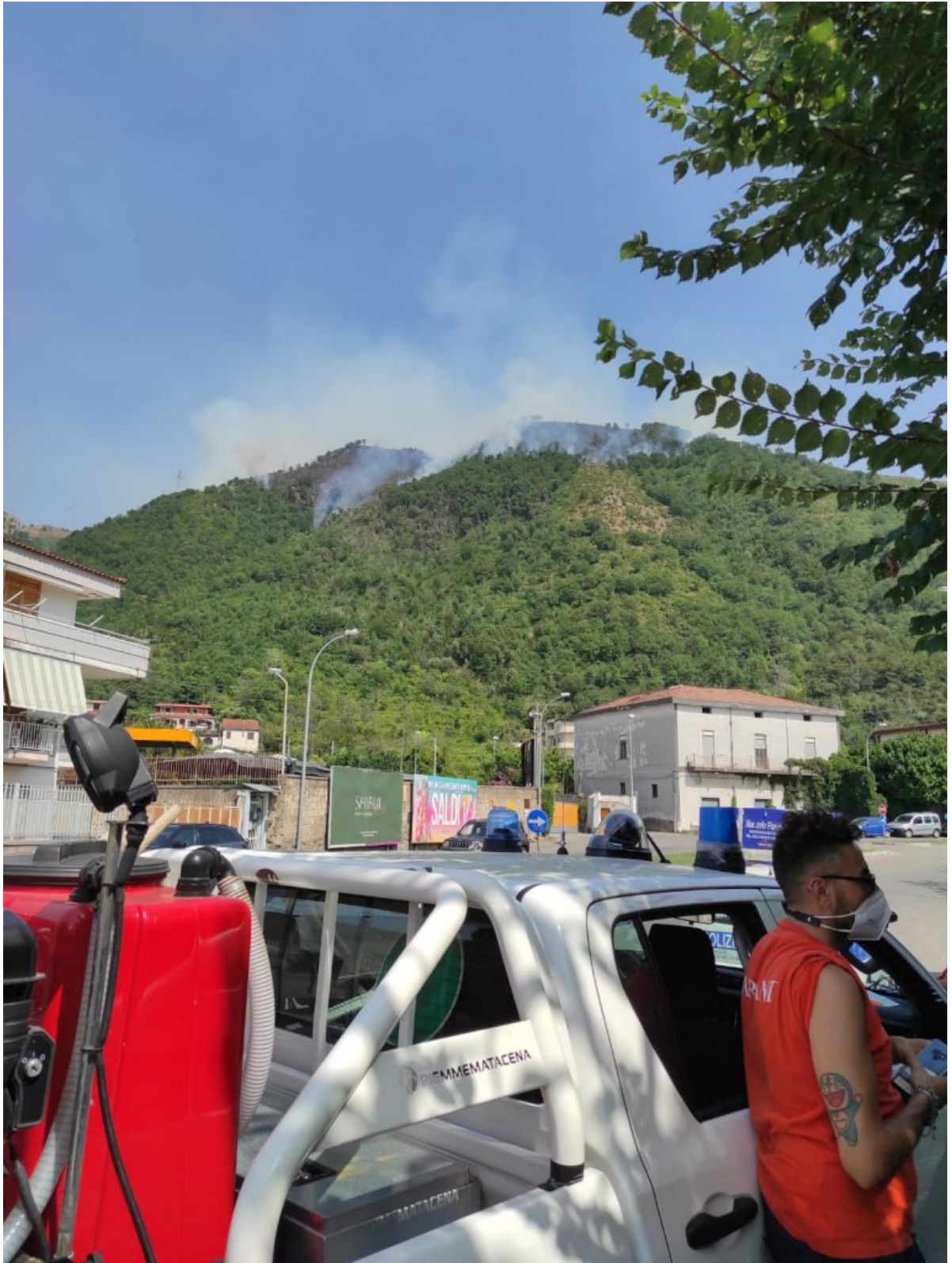
Incendio Monte Citola del 28 luglio 2021