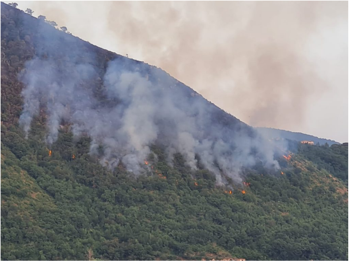
■ Incendio Monte Citola del 29 luglio 2021