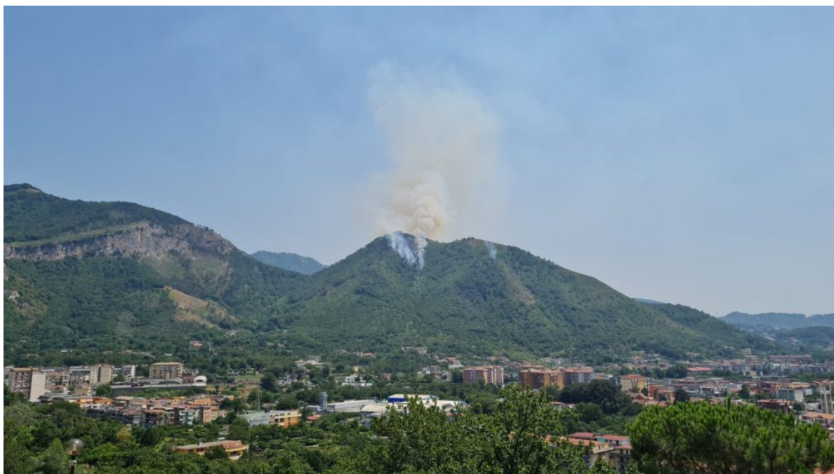
Incendio Monte Citola del 28 luglio 2021