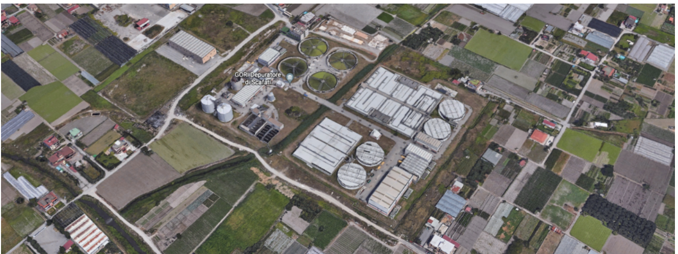
Depuratore di Scafati

Il 24 agosto 2021 è stato creato un incontro promosso dal Sindaco di Scafati al palazzo comunale di città per affrontare la problematica depurativa del medio sarno che ha interessato in questi giorni il Depuratore comprensoriale di Scafati.