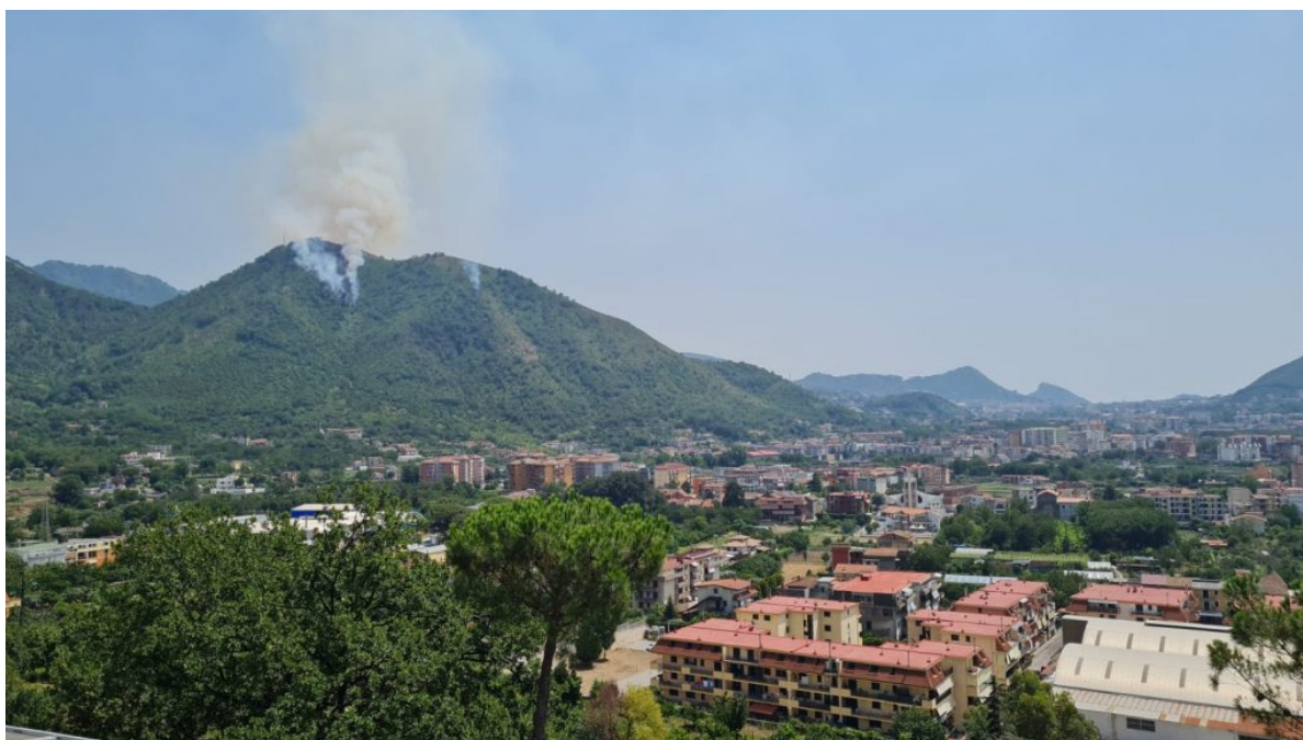
Incendio Monte Citola del 28 luglio 2021