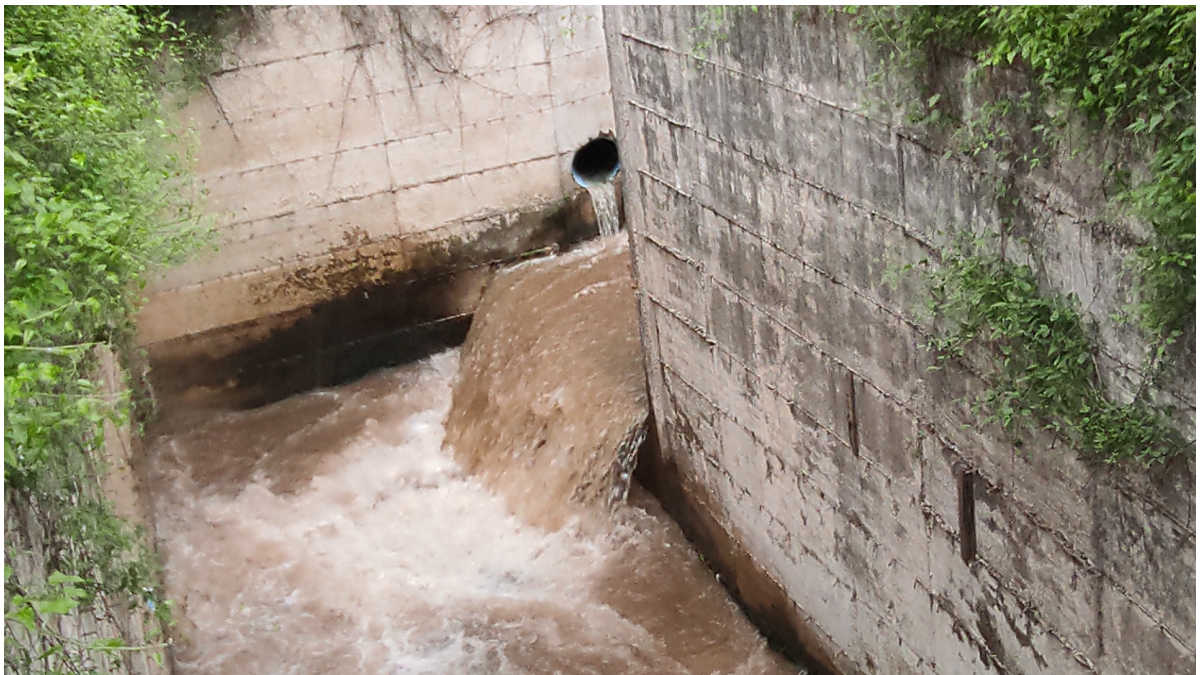
Fiumarello, affluente del Torrente Solofrana che sfocia nella Vasca di laminazione in Mercato San Severino denominata Vasca di laminazione Pandola

Forino essendo Bacino Endoreico ha una problematica comune a tutti i Bacini piccoli e antropizzati, ossia, la propria defluizione delle acque. Infatti quando Forino “si allaga” le