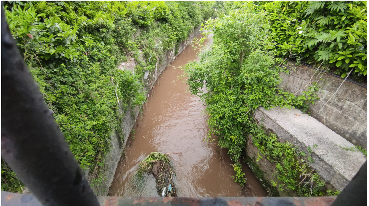
Torrente Solofrana in Mercato San Severino nella frazione di Pandola