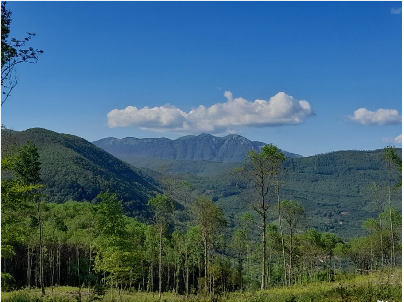
Panorama montuoso da Forino

Da qui si apre un percorso prevalentemente in piano che attraversa i boschi di castagno selvatico e si conserva la presenza di qualche isolato Faggio. Durante il percorso si può godere dei suoni che la natura offre. Ad un tratto del sentiero, in una breve curva è possibile osservare anche una notevole parete rocciosa dove per l'intero periodo autunno, inverno e primavera è presente anche un ristagno d'acqua e per i più fortunati è possibile osservare anche la "Salamandra Pezzata".