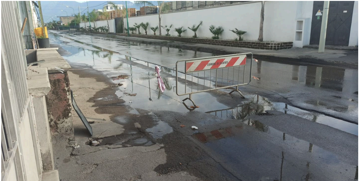
Strada allagata in Via Nuova San Marzano e Via Lo Porto in Scafati (Sa)

Il Canale Conte di Sarno potrebbe essere una soluzione per raccogliere le acque meteoriche che provengono dal monte e vulcano. Una vera e propria grondaia che tarda ad essere rifunzionalizzata. Inoltre ad aggravare la condizione già pessima sono le immissioni presumibilmente abusive di industrie che fanno defluire i propri reflui nelle canalizzazioni di acque bianche a bordo strada di Via Nuova San Marzano.