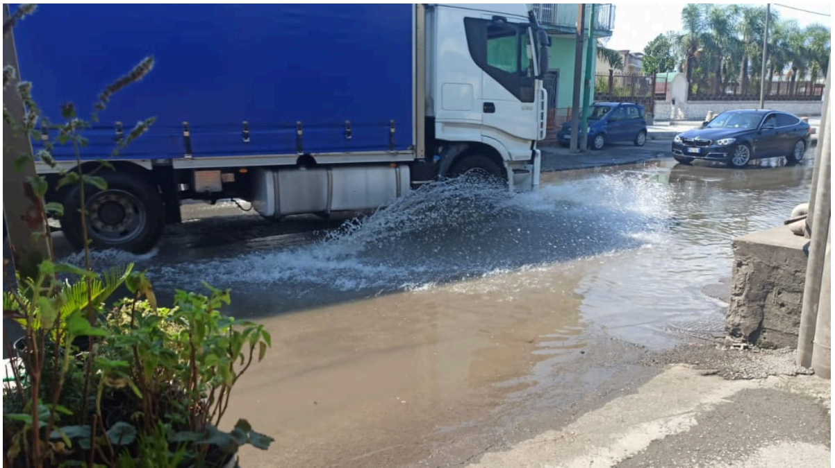
Strada allagata in Via Nuova San Marzano e Via Lo Porto in Scafati (Sa)