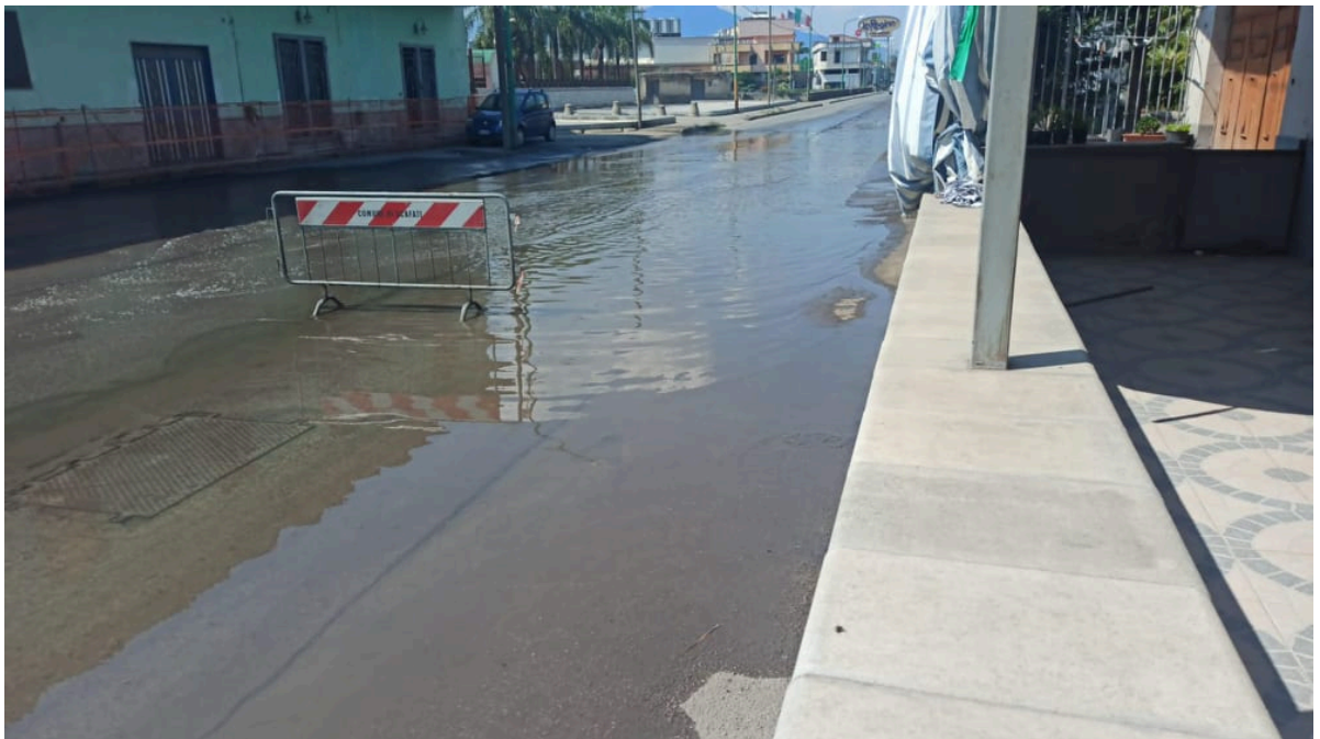
Strada allagata in Via Nuova San Marzano e Via Lo Porto in Scafati (Sa)