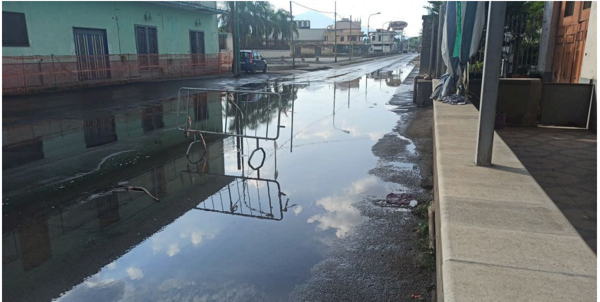
Strada allagata in Via Nuova San Marzano e Via Lo Porto in Scafati (Sa)