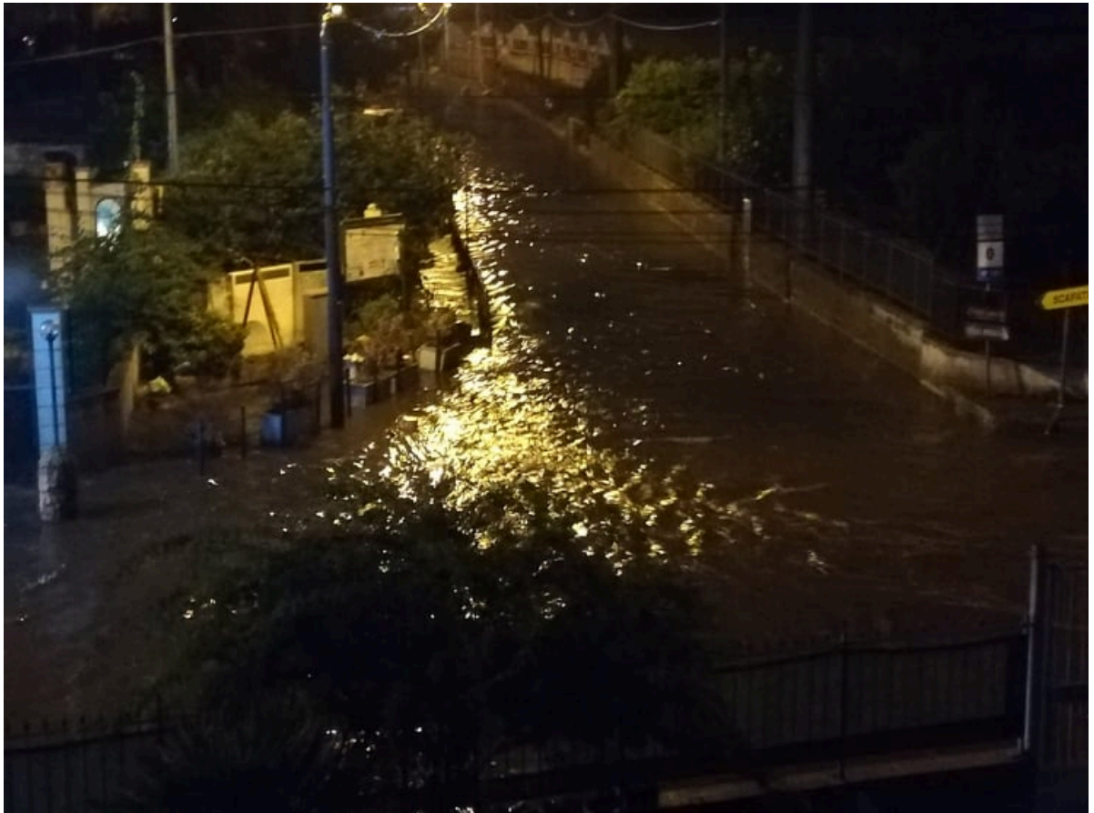
Strada allagata in Via Nuova San Marzano e Via Lo Porto in Scafati (Sa)