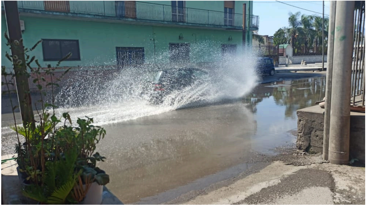
Strada allagata in Via Nuova San Marzano e Via Lo Porto in Scafati (Sa)