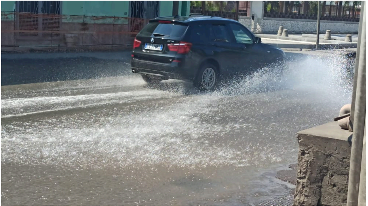
Strada allagata in Via Nuova San Marzano e Via Lo Porto in Scafati (Sa)