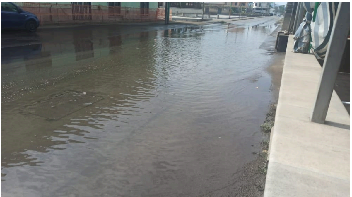
Strada allagata in Via Nuova San Marzano e Via Lo Porto in Scafati (Sa)