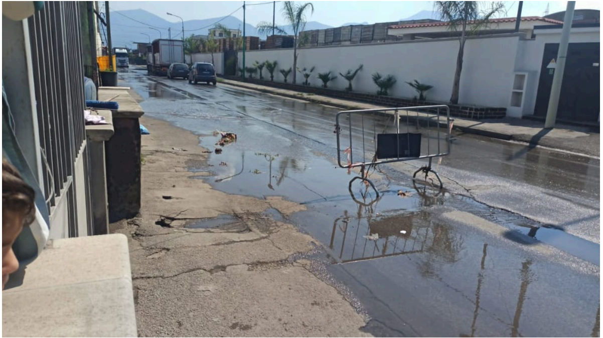
Strada allagata in Via Nuova San Marzano e Via Lo Porto in Scafati (Sa)