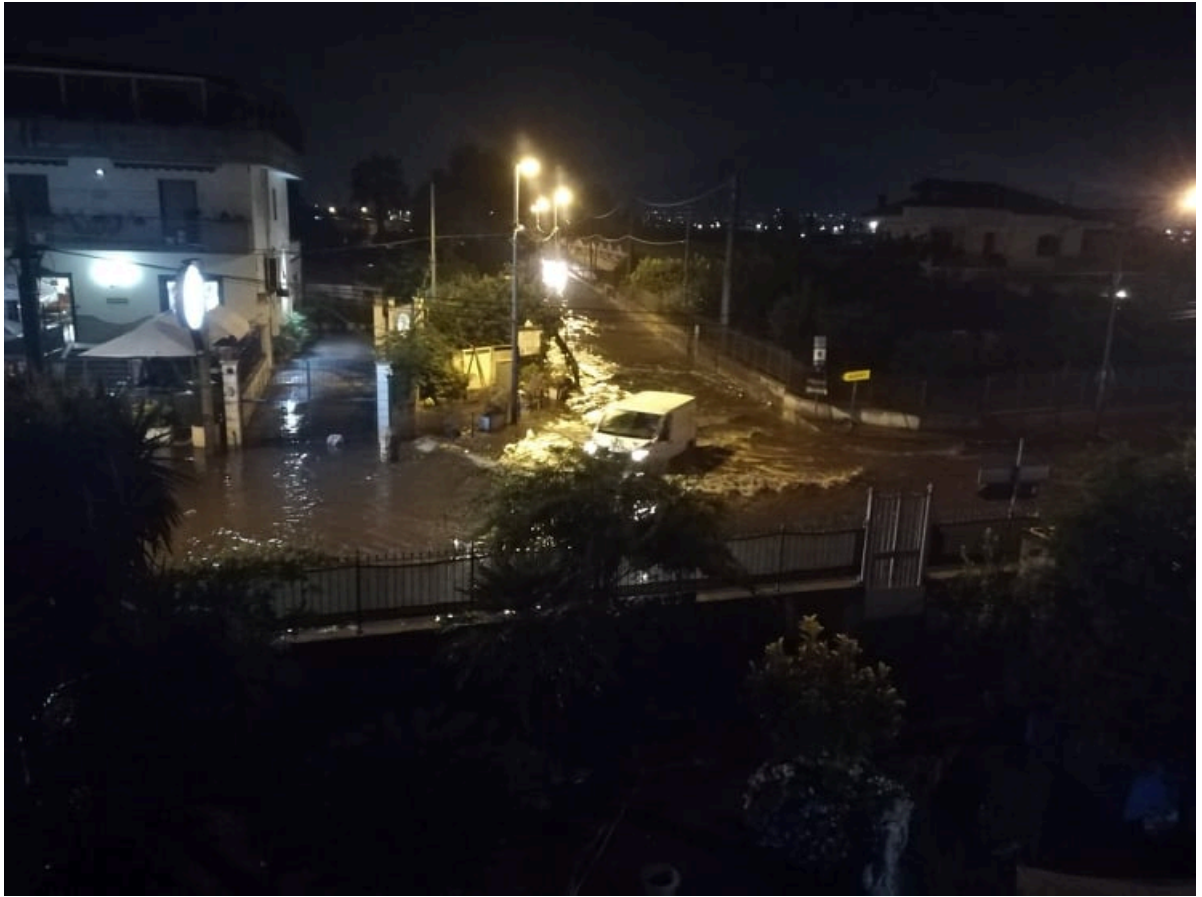
Strada allagata in Via Nuova San Marzano e Via Lo Porto in Scafati (Sa)