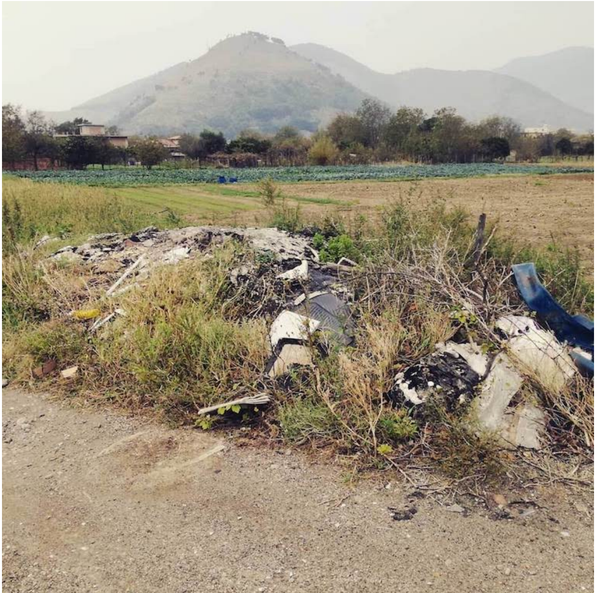
11 ottobre 2018 abbandono di rifiuti e rogo di rifiuti in Castel San Giorgio Salerno