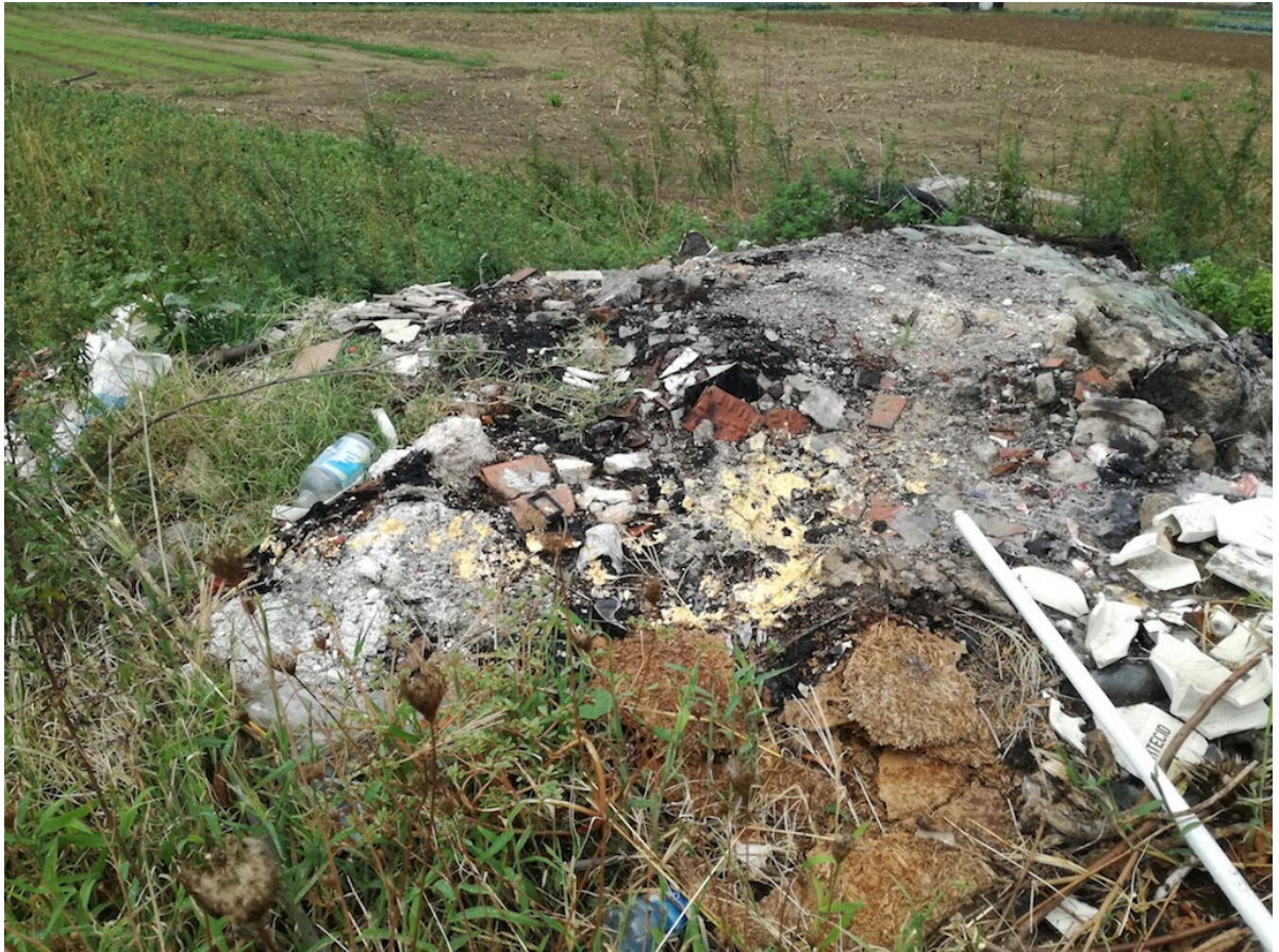
12 maggio 2021 abbandono di rifiuti e rogo di rifiuti in Castel San Giorgio Salerno