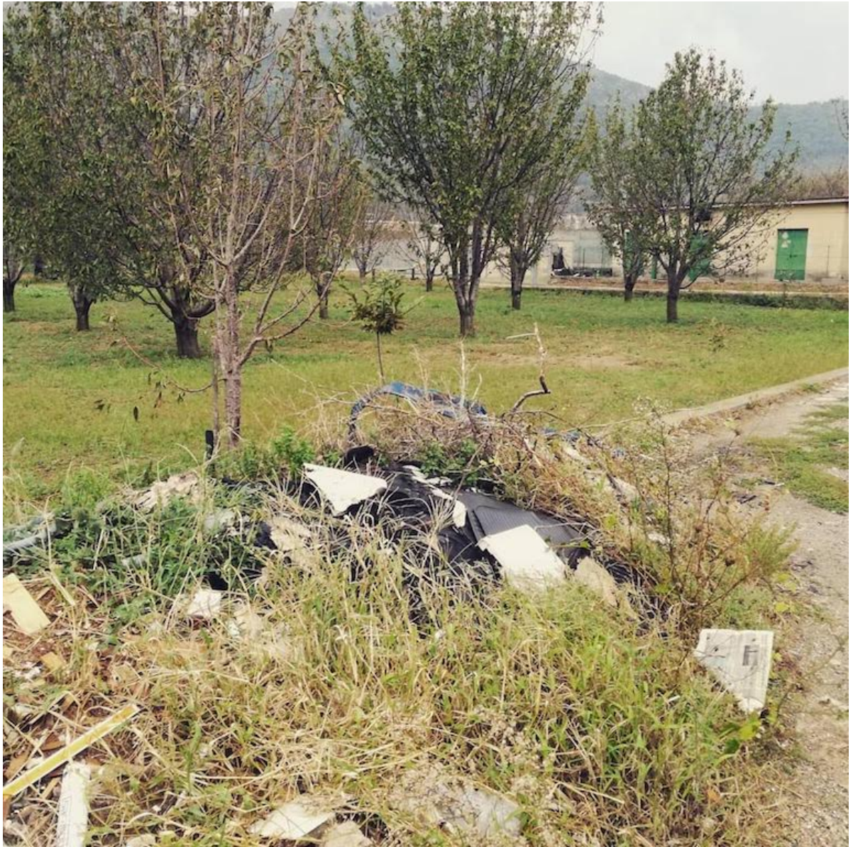
11 ottobre 2018 abbandono di rifiuti e rogo di rifiuti in Castel San Giorgio Salerno