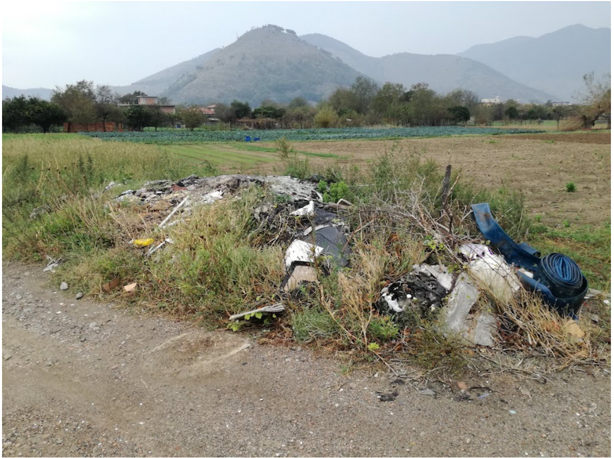
■ 12 maggio 2021 abbandono di rifiuti e rogo di rifiuti in Castel San Giorgio Salerno