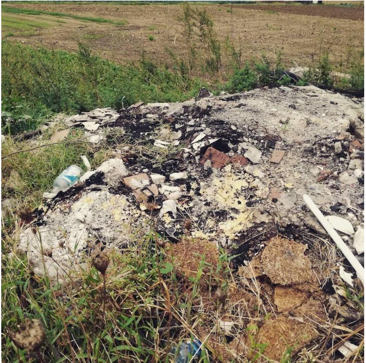
11 ottobre 2018 abbandono di rifiuti e rogo di rifiuti in Castel San Giorgio Salerno