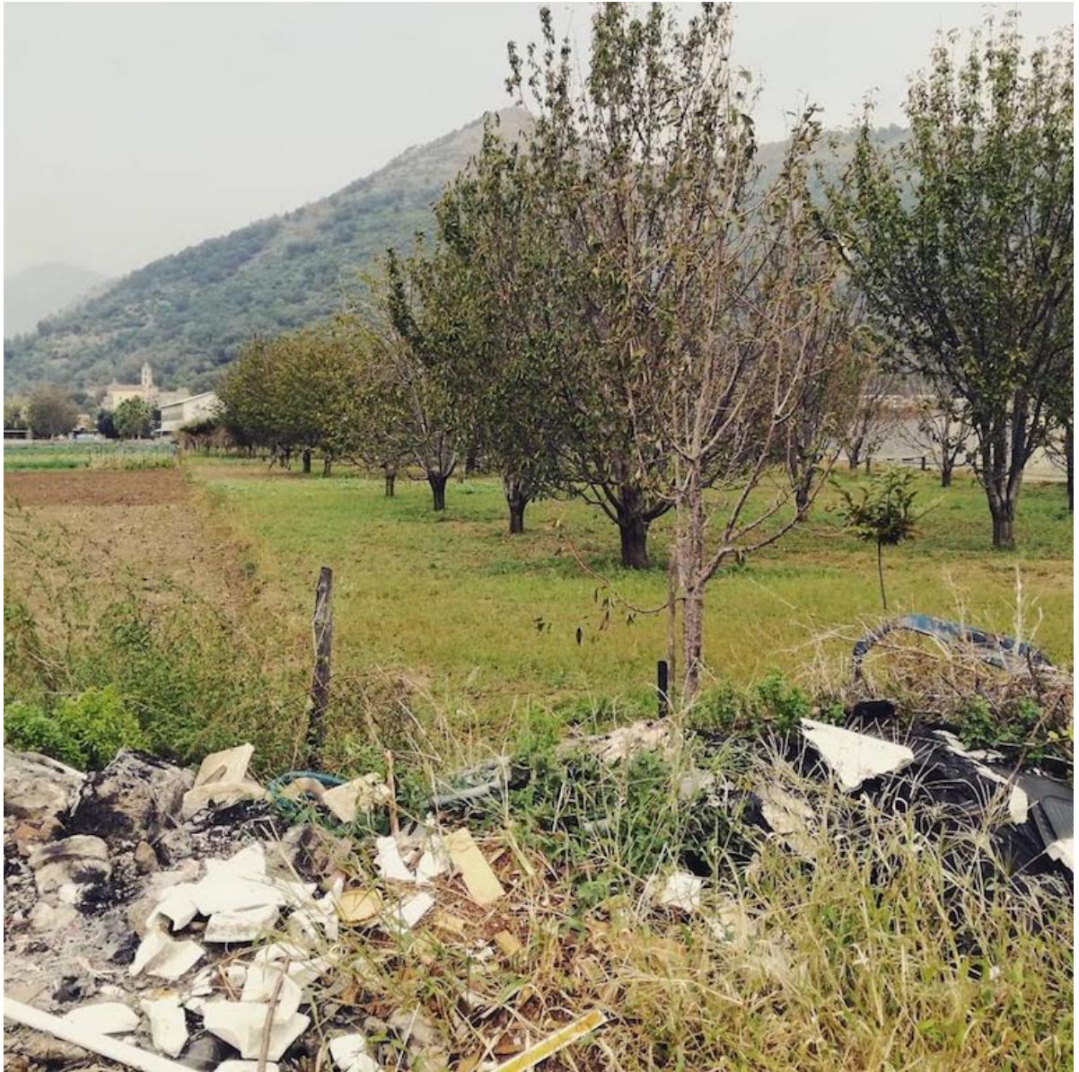
11 ottobre 2018 abbandono di rifiuti e rogo di rifiuti in Castel San Giorgio Salerno