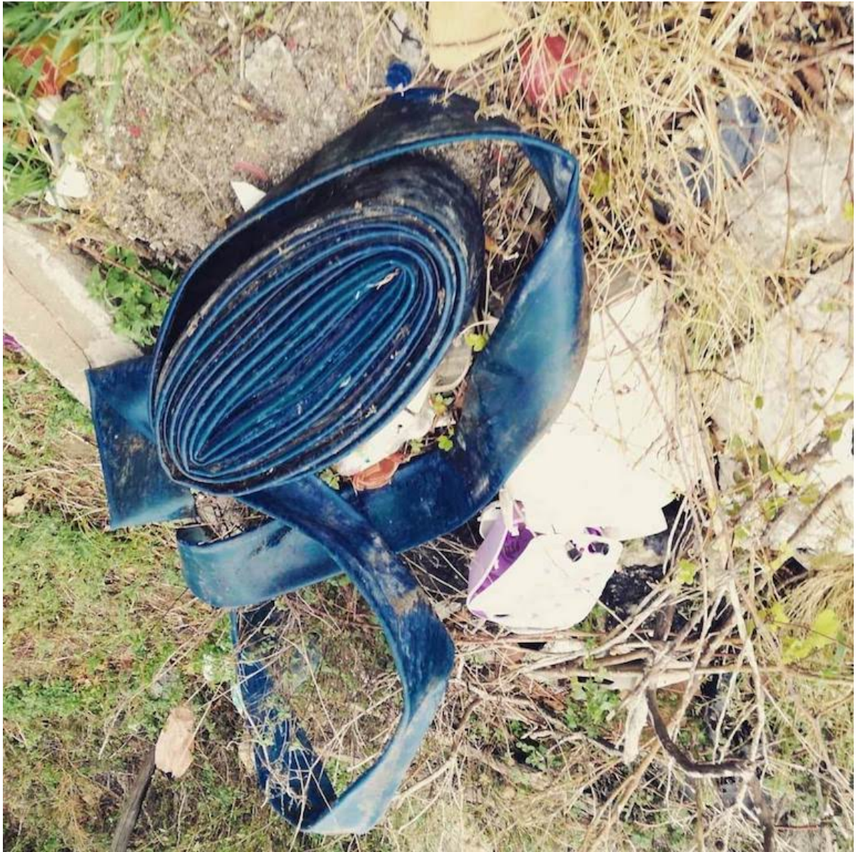
11 ottobre 2018 abbandono di rifiuti e rogo di rifiuti in Castel San Giorgio Salerno