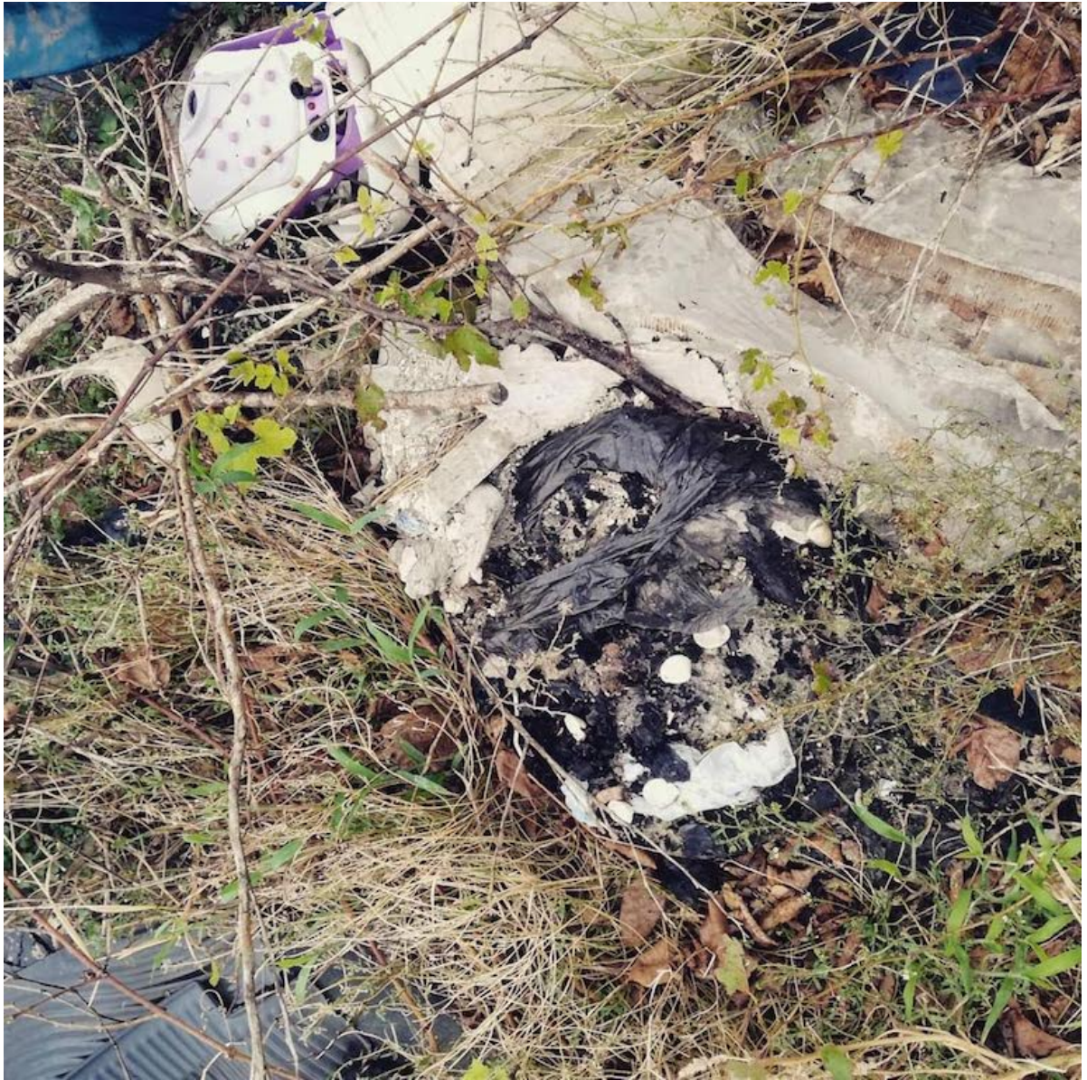
11 ottobre 2018 abbandono di rifiuti e rogo di rifiuti in Castel San Giorgio Salerno